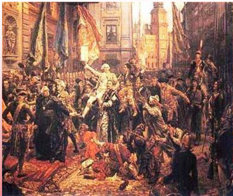
Widok Sejmu w czasie uchwalania Konstytucji 3 Maja

Dzień ten został uznany świętem już 5 maja 1971 roku. Ponownie, po odzyskaniu niepodległości w 1918 roku, 3 maja został uznany za święto państwowe na mocy uchwały Sejmu z dnia 29 kwietnia 1919 roku. Od 1946 roku świętowanie tego dnia było zakazane przez władze aż do roku 1990 kiedy to, 6 kwietnia, Sejm ponownie przywrócił to święto.